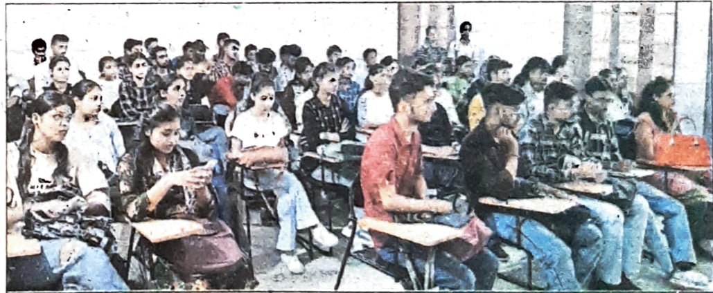
कार्यक्रम में उपस्थित विद्यार्थी।